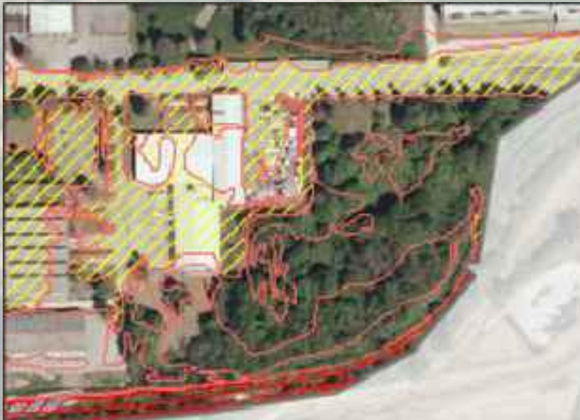
Prikaz območij poplavne nevarnosti