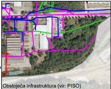
Obstoječa infrastruktura